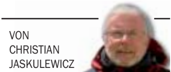
VON CHRISTIAN JASKULEWICZ

BRETTORF/BUENOS AIRES/USHUAIA – Unendliche Weite, Einsamkeit und Freiheit hatten wir gesucht. Jetzt, zwischen Weihnachten und Neujahr, ist alles Wirklichkeit: wilde Natur, kaum Menschen, höchstens zwei Autos pro Tag und endlose Pampa mit Schotterstraßen, Guanokos,