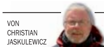
VON CHRISTIAN JASKULEWICZ

BRETTORF/BUENOS AIRES/USHUAIA – Mitte Januar lag wieder eine Prüfung für den Wagen, aber auch für uns an. Wir hatten die Andenkordillere (das zweithöchste Gebirge) auf unserem Weg nach Mendoza in Argentinien an der Stelle überquert, wo sich der höchste Berg außerhalb Asiens, der Cerro Aconcagua, mit 6962 Metern befindet.