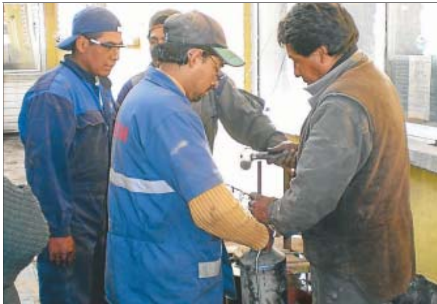
Kontrolle in der Werkstatt: In Santiago de Chile wird das Wohnmobil des Ehepaars überprüft.

Schnell zeigte sich, dass unser modernes Fahrzeug für die unbefestigten Straßen Südamerikas nicht geeignet war. Der Bordcomputer stellte ein großes Hindernis dar. Schon in Argentinien kamen die ersten Warnmeldungen: „SRS-Rückhaltesystem, Gurte und Airbag außer Funktion, Werkstatt aufsuchen“. Kurz